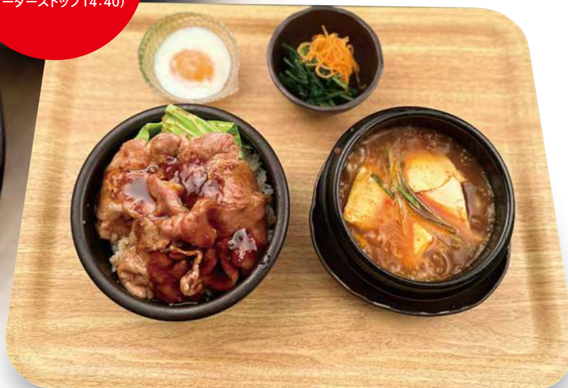
※写真は温玉付きです。